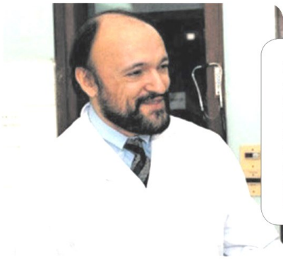
Der mittlerweile als Held gefeierte Entdecker von SARS-CoV-1, der italienische Arzt Carlo Urbani, starb möglicherweise an den Folgen einer Überbehandlung.

Corona-Virus als mögliche Ursache von SARS. In zwei von 50 Patienten seien mittels genetischer Testverfahren (PCR, siehe S.52 ff.) Corona-Viren nachgewiesen worden, bei 35 weiteren Patienten spezifische Antikörper. In einer Probe habe man das Bakterium «Escherichia Coli» gefunden und bei zwei anderen Patienten die Bakterien «Klebsiella pneumoniae» und «Haemophilus influenzae». (3) Diese Spuren wurden nicht weiterverfolgt, obwohl sie letztlich als Ursprung einer Krankheit nicht viel unwahrscheinlicher waren als die Coronaviren – von anderen Ursachen wie Luftverschmutzung usw., die niemals zur Diskussion standen, ganz zu schweigen. Die Entscheidung war gefallen: Das weltweite Labornetz der WHO würde sich jetzt nur noch mit dem Corona-Virus als mögliche Ursache von SARS beschäftigen.